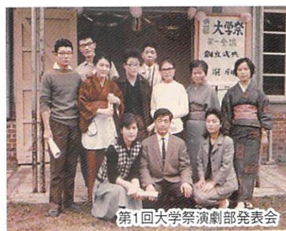
第1回大学祭演劇部発表会

学院内に今も残る聖恵館と二号館が、末永く我々同窓生の思い出の建物として温存されることを希望します。末筆となりましたが、同窓生の皆様様の御多幸と同窓会の益々の御発展を心よりお祈り申し上げます。