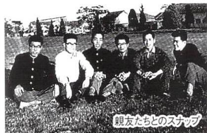
親友たちとのスナップ

私は1962年度に短大を卒業、同年に大学に編入。1964年度に英文学科第2期生として、英文学科12名、基督教学科7名とともに卒業しました。少人数でしたが、お互いを理解し、よき友人であり、よきライバルでした。