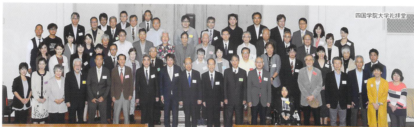
四国学院大学礼拝堂