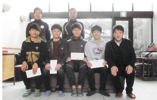
●2019年12月 第3回全日本大学サッカー新人戦