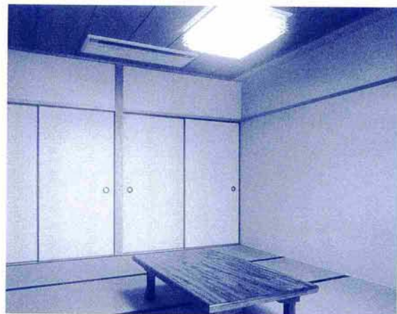
3階 和室(4人2室) 一室7,500円 お風呂・トイレ/タオル・浴衣有