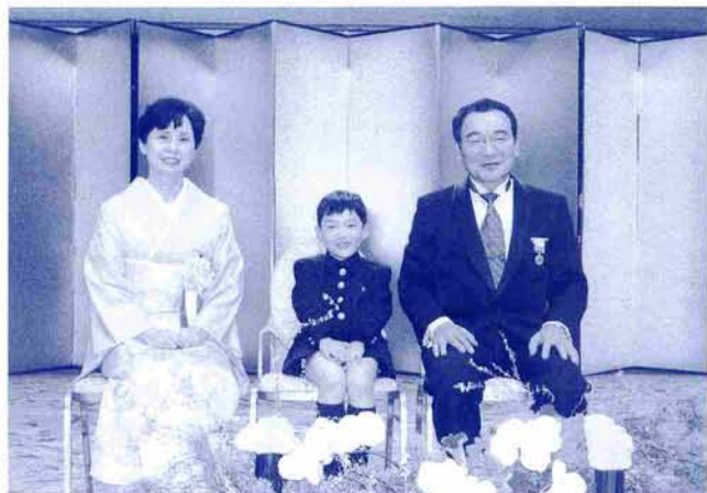
(お孫さんと祝賀会にて)