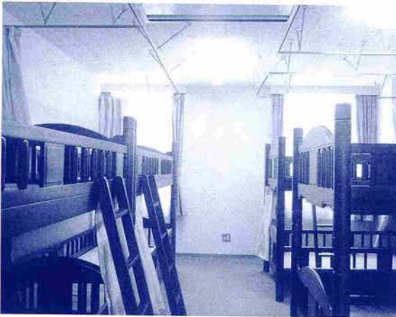
2階 洋室(6人、10人各1室) 一人1,200円