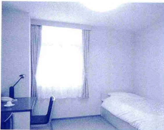
3階 個室(4室) 一室3,000円 お風呂・トイレ/タオル・浴衣有