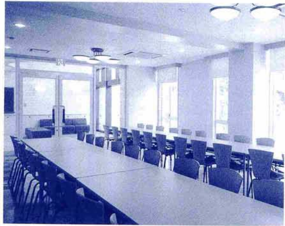
ホ ー ル