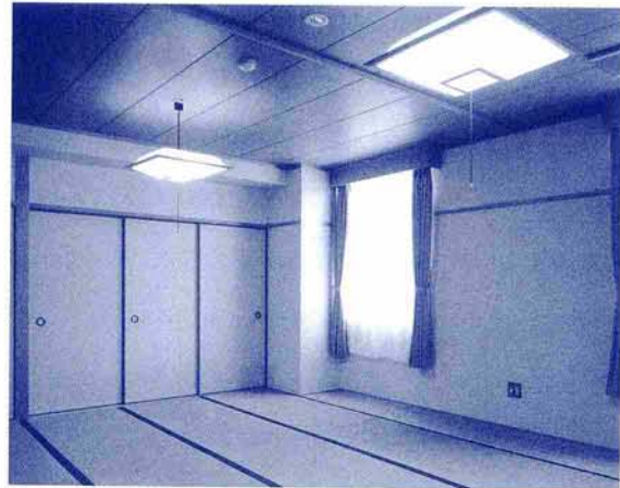
2階 和室(8人程度2室) 一人1,200円